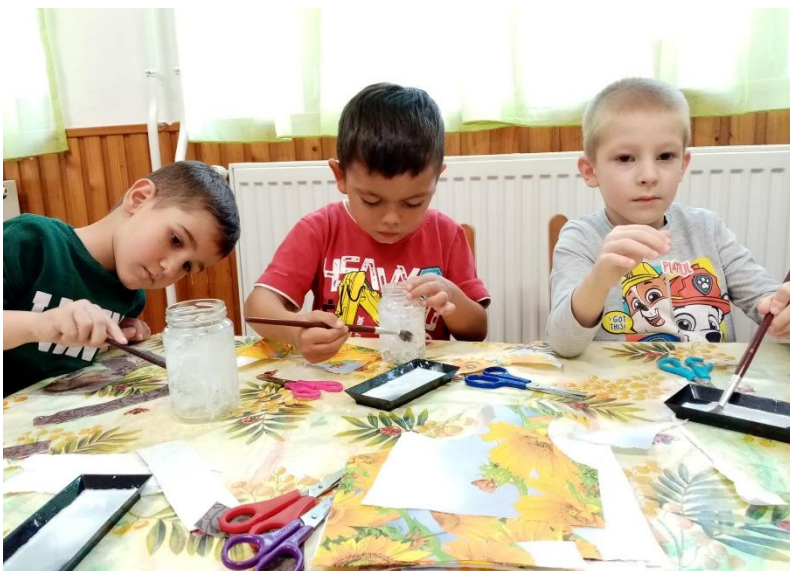
Márton-napi lámpás készítése